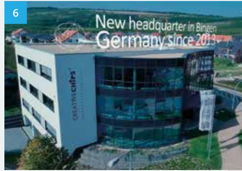
Creative Chips Imagefilm 2014