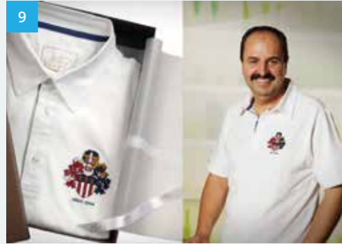
Jefferys Fashion, Concept & Design Imagefilm 2014