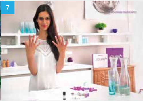
German Dream Nails / Jolifin Produktfilm & Werbespot 2014