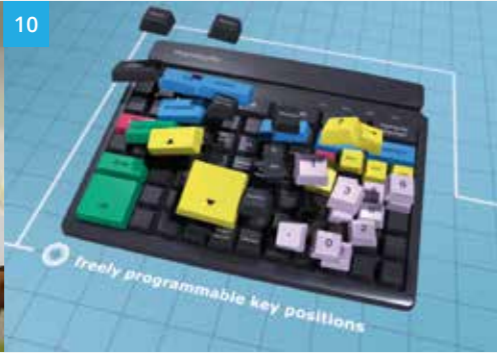
Prehkeytec Imagefilm 2014