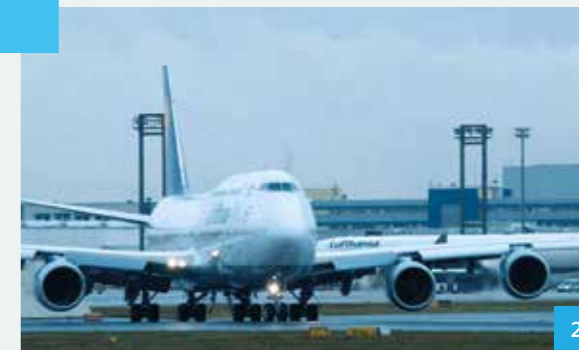
Smiths Detection - Security is a matter of trust Markenfilm 2015